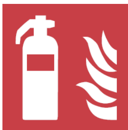
4. kép: Tűzoltó készülék szabvány szerinti jelölése