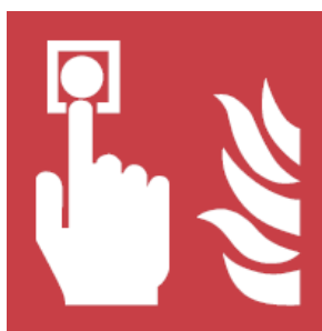
1. kép: Kézi jelzésadó szabvány szerinti jelölése