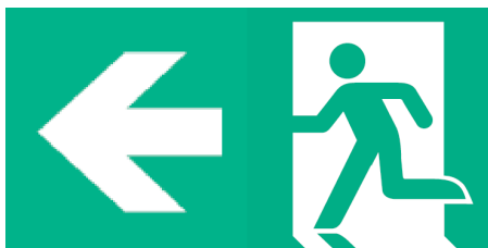
2. kép: Menekülési útvonal szabvány szerinti jelölése